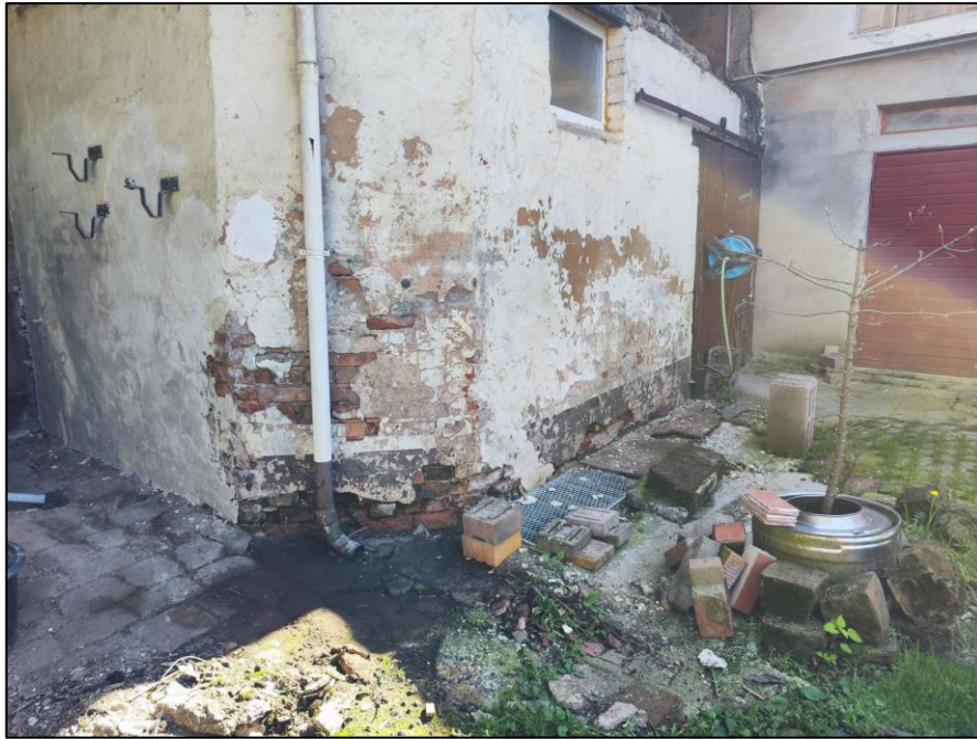
Pferdebox von außen vor der Renovierung