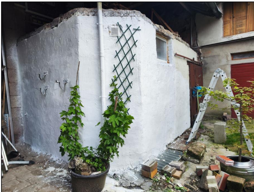
Pferdebox nach der Renovierung