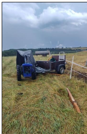
Der versetzte Einachser

Im Hochsommer traf uns ein starker Sturm. Unser großes Pavillonzelt wurde trotz des schweren Metallgestänges von den Böen angehoben und über den Hof geschoben. Glücklicherweise bremste die Scheune den Flug. Der Wind war so heftig, dass sogar unser kleiner Einachser mit Anhänger draußen an der Eselweide um mehrere Meter zur Seite geschoben wurde – bis knapp vor den Esel Zaun. Mehrere Abdeckplanen wurden ebenfalls beschädigt und mussten ersetzt werden.