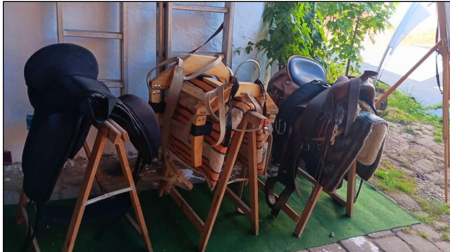
Sattelausstellung vor der Scheune

Im ehemaligen Hundeauslauf musste der große Nussbaum entfernt werden. Seine Äste ragten über den Gastank hinaus und stellten damit ein Sicherheitsrisiko dar. Zudem hatte sich der Baum bereits weit auf das Nachbargrundstück bis auf das Dach des dortigen Hühnerstalls ausgedehnt. Für diese Arbeit engagierten wir einen Fachbetrieb, der den großen Stamm ohne Schäden für uns oder den Nachbarn fällen konnte. Das Holz wurde so geschnitten, dass wir es als Brennholz einlagern können.