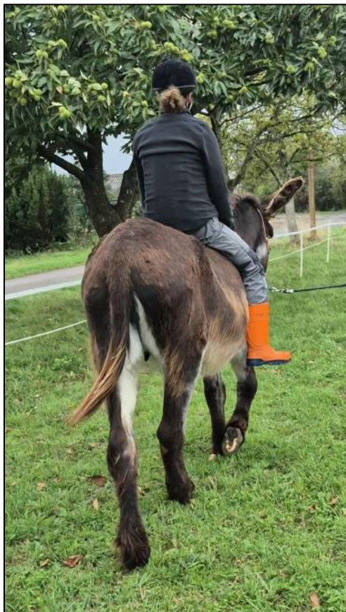
Dana mit Reiterin

Im Sommer konnte eine Jugendliche das Reiten auf unserem Fionn üben und gemeinsam mit ihm lernen. Auch Dana wurde von ihr erstmals geritten und verhielt sich dabei ebenso entspannt und selbstverständlich wie ihr jüngerer Halbbruder. Das Reiten auf einem Esel ist ein gemeinsames, gemütliches Fortbewegen und deutlich sicherer als das Reiten eines Pferdes.